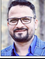
विज्ञान रिमाल दिग्गज

नेपालमा मनाउने दिवस आफैमा एउटा परम्पराको रूपमा मान्यता लिइसकेको हुन्छ तर त्यसमा अतिरिक्त परिवर्तन र नयाँ नेपालको परिपक्वतामा त्यसलाई पुनः परिभाषित गरिएको हुनुपर्ने देखिन्छ । हामीले बालबालिकालाई औपचारिकतामा मात्रै मनाइरहेको महसूस हुने गरेको छ । बागमती बालबालिकाको निमित्त चाहिने आभारपूर्वक हकअधिकार वा उनीहरूको संरक्षणको सवालमा हामीले कति उल्लेखी हलिस गर्न सकेका वा सकेकी । त्यसमा पछले पनि राष्ट्रिय