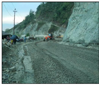
राजा महेन्द्रले यसकारण बनाए कान्ति लोकपथ निर्माण योजना

साझाकुरा संवाददाता हेटौंडा/२०११ सालको बाहीपहिरोले ललितपुर, बागमती नदी क्षेत्र अनुपपार र मकवानपुरको पूर्वी भागमा ठूलो धनजनको अती भयो । बाही पहिरोपीडितका लागि विभिन्न राष्ट्रहरूले दाल, चामल, मकैदानपाव धुप सहयोग दिएका थिए । सर्वसाधारण घर बाराविहान भएका कारण विपन्न, अर्द्धन, ओह्याउनेसमेत नेपालले सहयोगस्वरूप पाएको थियो । त्यतिबेला मेहेन्द्र शाह राजा थिए । उनले सहयोग स्वरूप आफ्नो विभिन्न सामग्री लिनमा जनतालाई बाहुन चारेहुन् ।