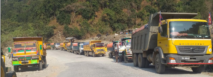
टिपरको रक्षा: त्रिभुवन राजपथ अन्तर्गत पर्ने मकवानपुरको उत्तरी क्षेत्र भीमफेदी गाउँपालिका-१ स्थित बाघभोरा गाँबिक टिपरको लाइन । नदी उखान्न परेर गाँब नोड गरिएका टिपर राजपथमा घण्टी लाग्नमा बन्ने गरेका छन् । जसका कारण साँघुरो सडकमा दुर्घटनाको जोखिम बढ्ने गरेको छ ।