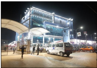
हेटौडा/मकवानपुरमा आइतबार थप ३ जनामा कोरोनाभाइरस (कोभिड-१९) संक्रमण पुष्ट भएको छ।