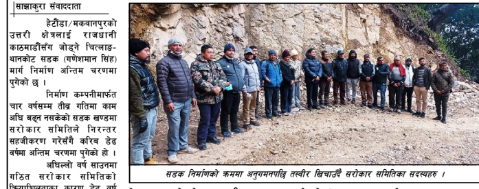
सडक निर्माणको अन्तिम चरणमा अग्रगण्य गतिमा काम भइरहेको चित्लाड-थानकोट सडक निर्माणको अन्तिम चरणमा अग्रगण्य गतिमा काम भइरहेको छ।

चित्लाड-थानकोट सडक निर्माणको अन्तिम चरणमा अग्रगण्य गतिमा काम भइरहेको छ। सडक निर्माणको अन्तिम चरणमा अग्रगण्य गतिमा काम भइरहेको छ। सडक निर्माणको अन्तिम चरणमा अग्रगण्य गतिमा काम भइरहेको छ।