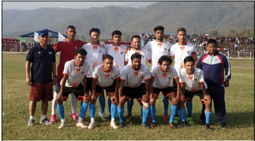
नुवाकोटसँग प्रतियोगिता गर्नुपर्ने सामूहिक तस्वीर खिचिउँदै मकवानपुर जिल्ला फुटबल टिम ।