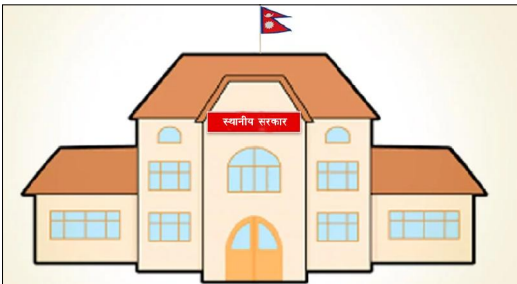
स्वामीय तहका जनप्रतिनिधिहरूलाई विवाहरीति रूपा आफ्नो कार्यभार हस्तान्तरण गर्न सूत्रबद्ध गरेको छ।