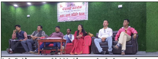
नेपाली कांग्रेस हेटौडा उपमहानगर समितिको तेस्रो पूर्ण बैठकमा सहभागी पदाधिकारीहरू ।