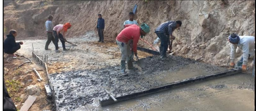
हेटौंडा उपमहानगरपालिका वडा नं. १ बैरबडाडाबाट नकीली जाने बाटो ढलान गरिँदै । यसवर्षमात्र यो क्षेत्रमा करिब एक किलोमिटर ल्याब ढलान भएको छ ।