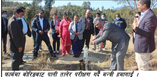
फार्ममा बोरिङबाट पानी तानेर परीक्षण गर्दै मन्त्री हुमागाईं।

हेटौंडा, २१ फागुन/ मकवानपुरको चित्लाडस्थित बाखा विकास फार्मले स्थापनाको ७८ वर्षपछि बल्ल पानी पाएको छ। बाखा, भेडा र खरायो पालन गर्दै आइरहेको सरकारी फार्ममा ७८ वर्षपछि पानी उपलब्ध भएको हो। नेपालकै पहिलो यो बाखा फार्म वि.सं. २००१ सालमा स्थापना गरिएको हो। तीनसय पाँच रोपनी क्षेत्रफलमा फैलिएको फार्मको एक सय ८ रोपनी चरिचरण क्षेत्र छ। चरिचरण क्षेत्रमा पानीको अभावले हिउँदमा खडेरी लाग्ने गरेको छ। खडेरी हटाउन फार्मलाई पानीको ठूलो आवश्यकता थियो। तर, फार्मको प्रबन्धक भएर आएका कयौले सरकारसँग पानीको व्यवस्था गरिदिन पहल गर्दै आएपनि कुनै सरकारले यतिका वर्षसम्म पानीको व्यवस्था गरेको थिएन। 'पानी नहुँदा हिउँदका ५ महिना बाखा, भेडाहरूले चरिचरण क्षेत्रमा पोषिलो हरिया घाँस खान पाएका थिएनन्। मकै, जई घाँस रोपेपनि पानी नहुँदा उभिने सम्भावना