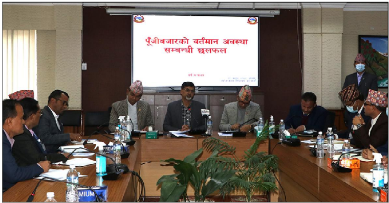
वर्तमान अवस्था सम्बन्धी छलफल भनिए पनि बुँदागत रूपमा ११ उनले वटा निर्देशन दिए । अर्थमन्त्री शर्माको उक्त निर्देशनको समाचार प्रकाशित भए पनि सामाजिक सञ्जालमा उनको प्रशंसा पनि भइरहेको देखिन्छ ।

काठमाडौं / मुलुकको आर्थिक अवस्था दयनीय भएको भन्दै सरोकारवाला र विज्ञहरूले दैनिक चासो र चिन्ता व्यक्त गरिरहेका छन् । बढ्दो आयातका कारण बाध्य क्षेत्रमा बढ्दो चुनौती र तरलताको चरम अभाव हुँदा वित्तीय क्षेत्रको बढ्दो लागतका कारण कम्पिउटिङको आर्थिक पुनर्स्थापनाको क्रममा रहेका उद्योगी व्यवसायी समस्यामा परेको बताइरहेका छन् ।