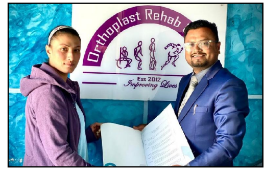
नेपाल फुटबल संघले आइतबार सार्वजनिक गरेको तालिका अनुसार पहिलो खेलमै एिएफ र आर्मी भिड्ने तय भएको हो । राष्ट्रिय महिला लिग १० चैतबाट सुरु हुँदैछ ।

काठमाडौं - राष्ट्रिय महिला लिगका लागि ललितपुर महानगरपालिका महिला फुटबल टिम र अर्थोप्लास्ट रिहायबिलिटेसन सेन्टरबीच सम्झौता भएको छ ।