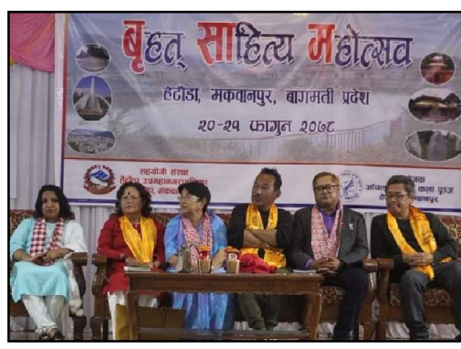
गजल तथा मुक्तक वाचन गरेका थिए । यस्तै पहिलो दिनको सौभ संघीय कार्यक्रमको आयोजना गरिएको थियो । उक्त कार्यक्रम हेटौँडाको एिएम सेन्टर र सुस्केरा परिवारले आआफ्नो प्रस्तुती दिएका थिए ।

महोत्सवको पहिलो दिन उद्घाटनसहित 'साहित्यमा राजनीति' विषयमाथि बहस भएको थियो ।