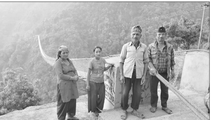
जिल्लाको उत्तरी क्षेत्रमा बाह्य नगरपालिका बडा नम्बर-११ स्थित नागदेहामा बनेको फोल्डो पुल। विगतमा फोल्डो पुल नबन्दा घण्टी हिँड्नुपर्ने बाध्यता रहेको थियो। अहिले पुल बन्दा बाह्य नगरपालिका बन्ने अवसर प्राप्त भएको छ।