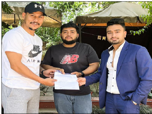
काठमाडौं/पछिल्लो समय नेपालमा थुप्रै रियल्टी सोहरू निर्माण भएका छन्। यस्ता सोका सञ्चालनमा विभिन्न कलाकारको समेत देखापर्छ। यस्ता सोका सञ्चालनमा विभिन्न कलाकारको समेत देखापर्छ।

काठमाडौं/पछिल्लो समय नेपालमा थुप्रै रियल्टी सोहरू निर्माण भएका छन्। यस्ता सोका सञ्चालनमा विभिन्न कलाकारको समेत देखापर्छ। यस्ता सोका सञ्चालनमा विभिन्न कलाकारको समेत देखापर्छ। यस्ता सोका सञ्चालनमा विभिन्न कलाकारको समेत देखापर्छ।