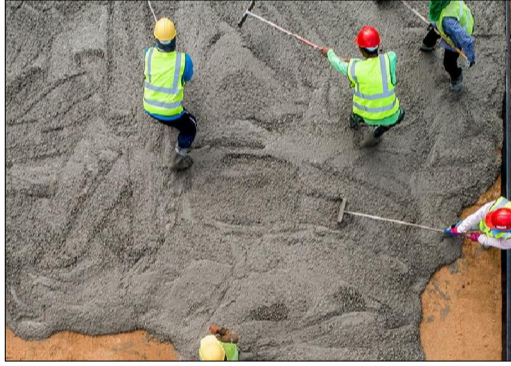
काठमाडौं/निर्माण सामग्रीमा बढ्दो मूल्यवृद्धि र भुक्तानी रोक्काको विरोध गर्दै आगामी आइतबारदेखि निर्माण व्यवसायीहरूले 'कन्स्ट्रक्सन होलिडे' गर्ने भएका छन्।