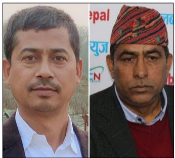
सो मुद्दालाई नै छोडेर मकवानपुरमा उनको पार्टी राप्रपा नेपालको प्रभाव कसो हुन सक्ने भन्दा अघि एमालेबाट विभाजन भएर नेकपा एकीकृत समाजवादी पार्टी बनेको छ भने राप्रपा नेपाल राष्ट्रिय प्रजातन्त्र पार्टीबाट निस्किएको पार्टी हो ।