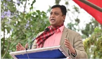
दुईजना दलीबाट पछाडि नहटेपछि आधा-आधा कार्यकाल सरकारको नेतृत्व गर्ने दलहरूबीच