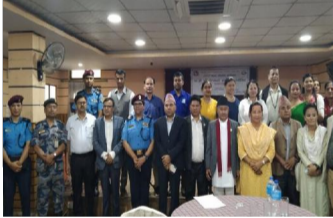
मानव अधिकार आयोगको स्थापना भएको बत्तार ।