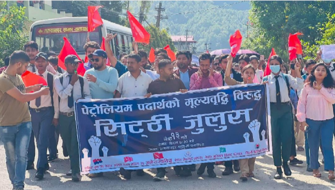
पेट्रोलियम पदार्थको मूल्यवृद्धि विरुद्धको विरोधमा विद्यापीठ संघटनहरूले चारगढ आन्दोलन थालेका छन्। नेकपा एमालेको मातृ संघटन अखिल नेपाल राष्ट्रिय स्वतन्त्र विद्यार्थी युनियन (अनेरास्ववियु) मकवानपुरले शुक्रबारपनि हेटौडाामा मूल्यवृद्धिको विरोधमा सिटी जुलुस गरेको थियो। अनेरास्ववियुले विद्यार्थी विरोध प्रदर्शनमा सरकारी सवारीसाधनको चाली नियन्त्रणमा लिएर प्रहरीलाई झुकाउने कार्यक्रम गरेको थियो। एमाले निकट राष्ट्रिय युवा संघ नेपाल, अनेरास्ववियु मकवानपुर, नेपाल खेकड महासंघ लगायत मातृ संघटनहरूको संयुक्त आयोजना शुक्रबार हेटौडाको बुद्धचोकमा आयोजना गरिएको थियो।