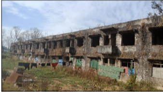
चीन सरकारको लगानी र उद्योगलाई उपयुक्त ढाँचामा सञ्चालन गर्ने बनेका छन् ।

हेटौंडा/हेटौंडा कपडा उद्योग सञ्चालनमा ल्याउने सरकारले घोषणा गरेको छ । संघीय सरकारको आगामी आर्थिक वर्ष २०७६/०८० को बजेट संसदमा प्रस्तुत गर्दै अर्थमन्त्री जनार्दन शर्माले हेटौंडा कपडा उद्योगसञ्चालनमा ल्याउने घोषणा गरेका हुन् ।