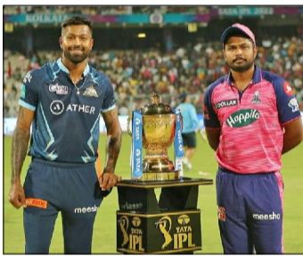
गुजरात टाइटन्स (बायाँ) र राजस्थान रोयल्स (दायाँ) फाइनल खेलिरहेका छन् ।

काठमाडौं / इन्डियन प्रिमियर लिग (आईपीएल) को १५ औँ संस्करणको फाइनल खेल भइरहेको जानकारी दिए । उपाधिका लागि पहिलो पटक आईपीएल खेलिरहेको गुजरात टाइटन्स र १४ वर्षपछि फाइनल पुगेको राजस्थान रोयल्स भिड्दै हुनेछ ।