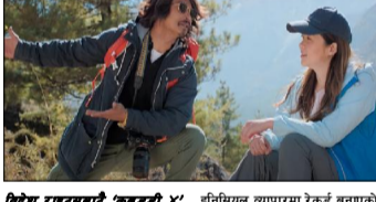
फिल्म 'कबड्डी ४'को कलाकारहरू।

समीक्षकले रुचाएका छन् । नेपाली फिल्मको इतिहासमा कमाई गर्ने कमाउने फिल्मको रकडं टोपकरज-दीपा समूहको 'छक्का पञ्जा' सिरिजसँग सुरक्षित छ । यसका तीव्रतम सिरिजको लक्ष्यकोटकलेसन् १६ करोड आयमा छ । अब यो रकडं तोड्नु पर्ने चुनौती 'कबड्डी ४'माथि छ ।