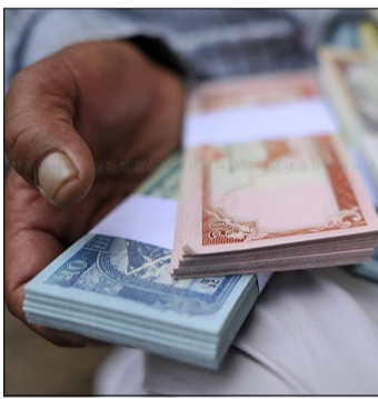
नेपालीको प्रतिव्यक्ति आम्दानी १८ हजार रुपैयाँले बढि भएको छ । आर्थिक वर्ष २०७७/७८ मा प्रतिव्यक्ति आम्दानी वार्षिक १ लाख ४६ हजार ५ सय २९ रुपैयाँ रहेकोमा चालु आर्थिक वर्ष १८ हजार रुपैयाँ बढेको हो ।

राष्ट्रिय आर्थिक समीक्षा प्रतिवेदनमा प्रस्तुत नेपालीको प्रतिव्यक्ति आम्दानी १ लाख ४६ हजार ५ सय २९ रुपैयाँ पुगेको अनुमान गरिएको छ । हाल अर्थतन्त्रमा उपभोगको हिस्सा ९०.७ प्रतिशत बराबर छ । यो आर्थिक वर्षमा यस्तो हिस्सा ९२.३ प्रतिशत थियो । उपभोगमा ११.५ प्रतिशत बृद्धि भएको छ ।