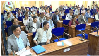
पटक बनेको प्रदेश सरकारको यो अन्तिम कार्यकाल हो । प्रदेश सरकारले पाँचौं