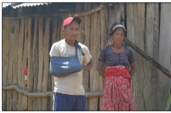
शुभा पद्म पाउने व्यवस्था पाउँदा बट्टा सन्तान भएको उनलाई गरिबिनुभयो, उनले फुसो गरिन् । छोराछोरीले राम्ररी पढ्न नपाएको दुख लाग्ने गरेको बताइन् ।

वर्षौं नै मत माग्ने आउनेहरूले दिएका आश्वासन पुरा नभएपछि उनलाई अब जग्गाधनीको लालपूर्जा पाइन्छ भन्ने आश लाग्न छोडेको बताउँछिन् । तर, भोट मान आउनेसँग उनले एउटा अपेक्षा भने राखेको बताउँछिन् । 'लालपूर्जा पाउँछु भन्ने त मलाई आश नै लाग्न छोडिसकेको बरि निगुन्क