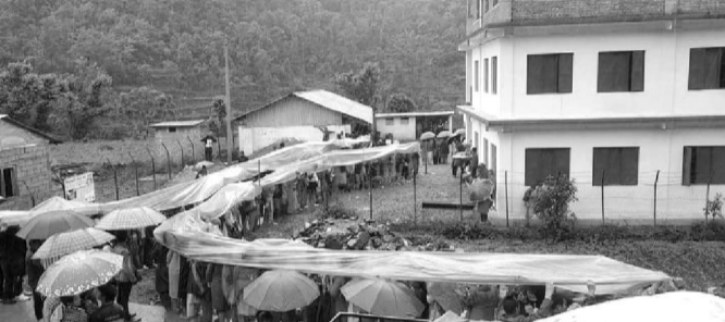
७) पानी परेपछि प्याक्टिक ओडेर मतदान गरिँ : शुक्रबार स्थानीय तहको निर्वाचन चलिबहाँदा मकवानपुरको धेरै स्थानमा पानी पर्यो । मतदानस्थलहरूमा विपन्नको व्यवस्था गर्नु मकवानपुरले प्याक्टिक नै ओडे भएपनि मतदान गरेका छुन् । इन्द्रसरोवर गाउँपालिका-१ मा रहेको चन्द्रोदय प्राथमिक विद्यालयमा मतदाताहरूले पानीमा प्याक्टिक ओडेर मतदान प्रक्रियामा सहभागीता जनाएका छुन् ।