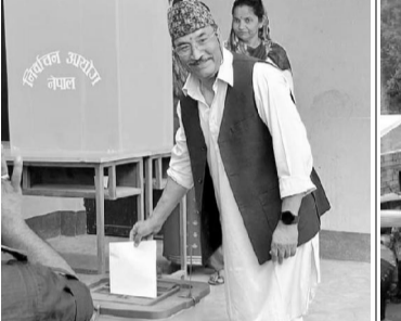
६) मतदान गर्ने कमल थापा : राप्ता नेपालका अध्यक्ष कमल थापाले गृहमन्त्रालयमा मतदान गरेका छुन् । उनले हेटौडा-६ स्थित वंशगोपाल उच्च माध्यमिक विद्यालयमा पुगेर मतदान गरेका छुन् ।