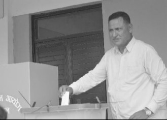
४) मतपेटिका मतपत्र बाह्यले स्वास्थ्ययन्त्री : संघीय सरकारको स्वास्थ्य तथा जनसंख्यामन्त्री विरोध बतियडाले हेटौडा-४ स्थित भुटनेवी मावीमा रहेको मतदान केन्द्रमा पुगी मतदान गरेका छुन् । मतदान परचात प्रतिक्रिया दिँदै उनले आफूले मतदान गरेको फरकै छिले दावी पनि गरे ।