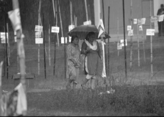
३) पानीले नुस्केको मतदान : शुक्रबार स्थानीय तहको निर्वाचनमा बलिरहँदा हेटौडामा ठुलो पानी परेको थियो । तर, पानीमा पनि छुत्ता ओढ्दै मतदाताहरू मतदानमा सहभागी भए । पाँच बर्षेसम्म भएको स्थानीय तहको निर्वाचनमा मतदाताहरूको उत्साहपूर्वक सहभागीता रह्यो ।