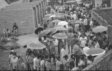
२) मतदान गर्न आइपुगेका मतदाता : शुक्रबार भएको स्थानीय तहको निर्वाचनमा मतदान गर्न लाइन बसेका मतदाताहरू । हेटौडा-१२ स्थित प्रतिमा आधारभूत विद्यालयमा रहेको मतदान केन्द्रमा मतदाताहरूले अन्य स्वामिना जसो उत्साहपूर्वक सहभागीता जनाएका थिए ।