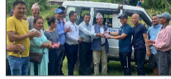
हेटौँडा उपमहानगरपालिका-८ वडा कार्यालयले गमी बढेको विद्यार्थीको स्वास्थ्य प्रश्न अघि पारिनेको भन्ने पढाई रोक्न निर्देशन दिइएको छ । हेटौँडा उपमहानगरपालिका-८ वडा कार्यालयले गमी बढेको विद्यार्थीको स्वास्थ्य प्रश्न अघि पारिनेको भन्ने पढाई रोक्न निर्देशन दिइएको छ । हेटौँडा उपमहानगरपालिका-८ वडा कार्यालयले गमी बढेको विद्यार्थीको स्वास्थ्य प्रश्न अघि पारिनेको भन्ने पढाई रोक्न निर्देशन दिइएको छ । हेटौँडा उपमहानगरपालिका-८ वडा कार्यालयले गमी बढेको विद्यार्थीको स्वास्थ्य प्रश्न अघि पारिनेको भन्ने पढाई रोक्न निर्देशन दिइएको छ । हेटौँडा उपमहानगरपालिका-८ वडा कार्यालयले गमी बढेको विद्यार्थीको स्वास्थ्य प्रश्न अघि पारिनेको भन्ने पढाई रोक्न निर्देशन दिइएको छ ।

हेटौँडा, १ साउन/ बुद्ध क्लबको बुद्ध युवा क्लबले आफूले सञ्चालन गर्दै आइरहेको एम्बुलेन्स स्वास्थ्य केन्द्रलाई हस्तान्तरण गरेको छ । बुद्ध क्लबले आफूले सञ्चालन गर्दै आइरहेको एम्बुलेन्स स्वास्थ्य केन्द्रलाई हस्तान्तरण गरेको छ । बुद्ध क्लबले आफूले सञ्चालन गर्दै आइरहेको एम्बुलेन्स स्वास्थ्य केन्द्रलाई हस्तान्तरण गरेको छ । बुद्ध क्लबले आफूले सञ्चालन गर्दै आइरहेको एम्बुलेन्स स्वास्थ्य केन्द्रलाई हस्तान्तरण गरेको छ । बुद्ध क्लबले आफूले सञ्चालन गर्दै आइरहेको एम्बुलेन्स स्वास्थ्य केन्द्रलाई हस्तान्तरण गरेको छ ।