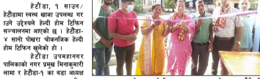
हेटौँडा उपमहानगरपालिका-४ सातो पोखरा चौकस्थित हेल्दी होम टिफिन सञ्चालनमा आएको छ । हेटौँडा उपमहानगरपालिका-४ सातो पोखरा चौकस्थित हेल्दी होम टिफिन सञ्चालनमा आएको छ । हेटौँडा उपमहानगरपालिका-४ सातो पोखरा चौकस्थित हेल्दी होम टिफिन सञ्चालनमा आएको छ । हेटौँडा उपमहानगरपालिका-४ सातो पोखरा चौकस्थित हेल्दी होम टिफिन सञ्चालनमा आएको छ । हेटौँडा उपमहानगरपालिका-४ सातो पोखरा चौकस्थित हेल्दी होम टिफिन सञ्चालनमा आएको छ ।

हेटौँडा, १ साउन/ हेटौँडामा स्वस्थ खाजा उपलब्ध गराउने उद्देश्यले हेल्दी होम टिफिन सञ्चालनमा आएको छ । हेटौँडा-४ सातो पोखरा चौकस्थित हेल्दी होम टिफिन खुलेको हो । हेटौँडा उपमहानगरपालिका-४ सातो पोखरा चौकस्थित हेल्दी होम टिफिन सञ्चालनमा आएको छ । हेटौँडा-४ सातो पोखरा चौकस्थित हेल्दी होम टिफिन सञ्चालनमा आएको छ । हेटौँडा उपमहानगरपालिका-४ सातो पोखरा चौकस्थित हेल्दी होम टिफिन सञ्चालनमा आएको छ । हेटौँडा उपमहानगरपालिका-४ सातो पोखरा चौकस्थित हेल्दी होम टिफिन सञ्चालनमा आएको छ । हेटौँडा उपमहानगरपालिका-४ सातो पोखरा चौकस्थित हेल्दी होम टिफिन सञ्चालनमा आएको छ ।