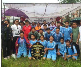
हेटौंडा, १९ असार/ बुद्ध माविले राष्ट्रीय स्तरको मकवानपुर जिल्लास्तरीय राष्ट्रपति र निडशिल्ड प्रतियोगिताको उपाधी जितेको छ।