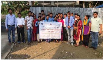
हेटौंडा, १९ असार/ मकवानपुरको विभिन्न क्षेत्रस्थित महाविद्यालय तथा विभिन्न जनप्रतिनिधिहरूलाई विपद् व्यवस्थापन तालिम प्रदान गरिएको छ।

हेटौंडा, १९ असार / मकवानपुरको विभिन्न क्षेत्रस्थित महाविद्यालय तथा विभिन्न जनप्रतिनिधिहरूलाई विपद् व्यवस्थापन तालिम प्रदान गरिएको छ।