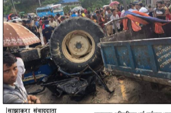
हेटौंडा, १९ असार/ टुफिक नियम विपरित जन्ती बोक्दा मकवानपुर र्को पूर्वी क्षेत्रस्थित बागमती गाउँपालिकामा एक ट्याक्टर दुर्घटनामा परेको छ।