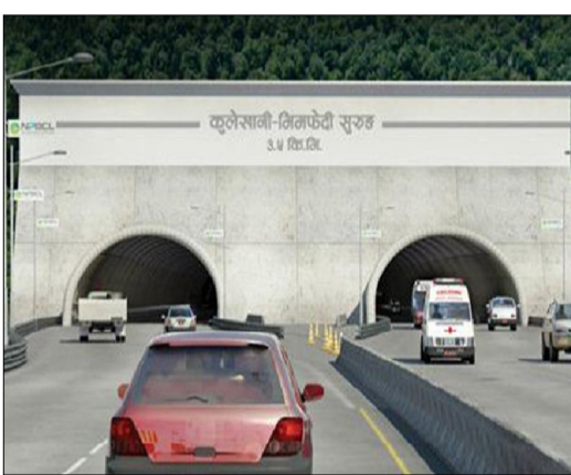
सम्भाव्यता अध्ययन गर्ने काम भने सडक विभागले गरिरहेको छ। बाँकी दुई वटाको अध्ययन चाँहि प्रदेश सरकारले नै गरिरहेको छ, सिंहले भने।

प्रवक्ता सिंहले प्रदेश सरकारले दुई वटा सुरुङ्ग मार्गको सम्भाव्यता अध्ययन गरिरहेको भए पनि एउटा सुरुङ्ग मार्गको सम्भाव्यता अध्ययनको काम सडक विभागले गरिरहेको जानकारी दिए। 'तीन वटै सुरुङ्ग मार्ग प्रदेश सरकारको नै योजनामा थियो। तर, हनुवन्तो-शक्तिखोर सुरुङ्गमार्ग निर्माणको