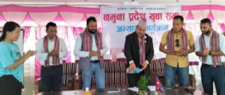
हेटौंडा, १९ असार/ प्रदेश युवा परिषद् बागमती प्रदेशको आयोजनामा हेटौंडामा नमुना प्रदेश युवा सभा अभ्यास कार्यक्रम सुरु भएको छ।