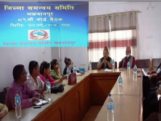
जिल्ला समन्वय समिति मकवानपुरको बैठकले जिल्लासभा गर्ने निर्णय गरेको हो ।

संघीयता टिकाउटिका नगर्न आग्रह गरेका छन् ।