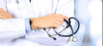
चितवन, ३० साउन (रासस)/ जिल्ला प्रकृति रोग नियन्त्रण विभागले स्वास्थ्य क्षेत्रमा फड्को मार्दै चितवनलाई अग्रसर बनाएको छ ।