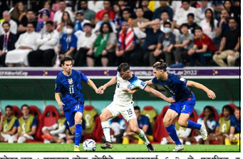
रहेका छन् । समूहका हरेक टोलीले दुई/दुई वटा खेन खेनिसकेका छन् । अहिलेसम्म इंग्ल्याण्डले

काठमाडौं/कतारमा जारी फिफा विश्वकप खेलमा अमेरिका र इंग्ल्याण्डबीचको खेल गोलरहित बराबरीमा सकिएको छ । विद्यार्थित ९० मिनेटको खेल निकै प्रतिस्पर्धात्मक रहे पनि दुवै टोलीले कुनै गोल गर्न सकेनन् । कतारको अल बायट रइशाभामा भएको खेल बराबरी भएसँगै दुवै टोलीले समान एक/एक अङ्क बाँडेका छन् । समूह बी मा रहेका दुवै टोलीले अन्तिम १६ मा पुग्ने सम्भावना भने कायम राखेका छन् । समूह बीमा इंग्ल्याण्ड र अमेरिकालाई इरान र वेल्स