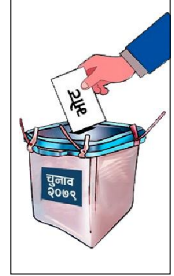
मतदान गर्ने कुरा

एउटा मतपत्रमा एक भन्दा बढी उम्मेदवार वा पार्टीलाई मत दिएमा बचत हुन्छ। मत सकेत गर्ने क्रममा स्वस्तिक छाप नबुकिने गरी स्वल्पितमा पनि मत बढाउनु हुन्छ। स्वस्तिक छाप बाहेक औंठा वा छाप लगाएमा पनि मत बढाउनु हुन्छ। साथै, भिन्न भएको कोठावाहिर छाप लगाएमा पनि मत बढाउनु हुन्छ। मतपत्रमा 'कसैलाई पनि भोट हालिदैन'