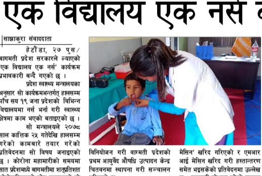
एक विद्यालय एक नर्स कार्यक्रमको अंतिम आठमा प्रवेश।