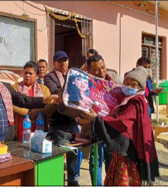
सतिदेवी माताको मन्दिर उद्घाटन कार्यक्रममा भाग लिन आएका मानिसहरू।