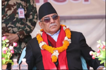
प्रधानमन्त्री दाहाल प्रचण्डसँग सम्वाद गर्न निर्णय गरेको छ ।

काठमाडौं/नेपाली कांग्रेसले सभामुख र उपसभामुखको निर्वाचनभारे प्रधामन्त्री पुष्पकमल दाहाल प्रचण्डसँग सम्वाद गर्ने निर्णय गरेको छ ।