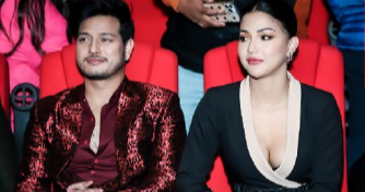
साझाकुरा 'तिम्रो मेरो साथ'को प्रिमियरमा सहभागिता लिएकी टिम्रो।