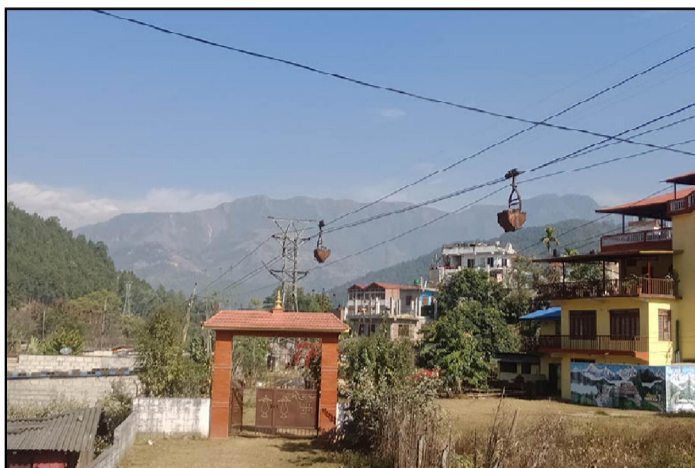
अतिशय ठोकेको रोप रो... नेपालमा नै पहिलो पटक तत्कालिन प्रधानमन्त्री पन्द्रमशेरले विसं १९८२ मा मकवानपुरको भीमफेदी नजिकको थोसे बजारमा ठोकेको रोप रोप...