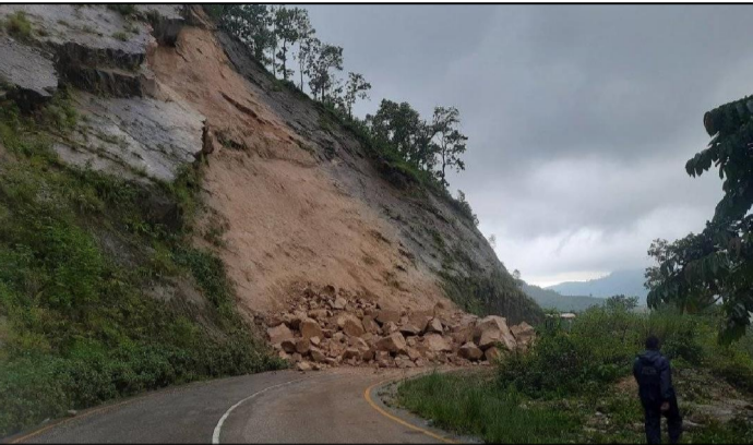
काठमाडौं-हेटौडा जोड्ने कानिनीकपथ शुरुवात सँग पहिलो जिंदा अवस्था भएको छ । कानिनीकपथअन्तर्गत जिल्लाको बकैया गाउँपालिका-११ बापकोटमा बर्चोले पहिलो जिंदा अवस्था भएको छ । पहिलो खन्दा सवारीसाधन रोकिएका छन् । कानिनीकपथमा बर्चोलेको समयमा निरन्तर पहिलो गइरन्छ । मन्सुन सुरुभएसम्म १ दर्जन पटक पहिलो गइसकेको छ ।