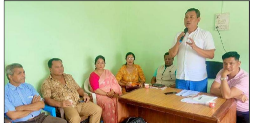
प्रतिनिधिसभा क्षेत्र-१ र २ को बैठक बसेको थियो । सोही अभियानअन्तर्गत साउन २५ र २६ गते मकवानपुरको प्रदेश सभा, नगरपालिका र गाउँपालिका समितिको बैठक बस्नेछन् । साउन २७ र २८ गते