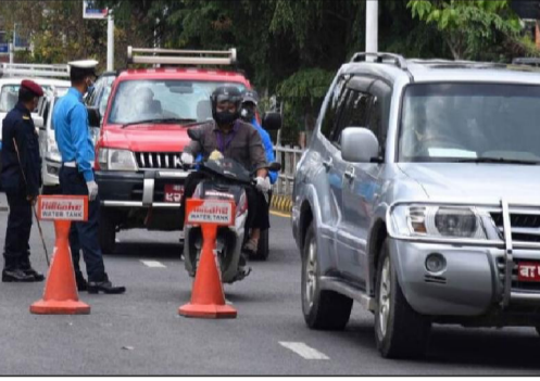
अधिल्लो आर्थिक वर्ष २०७८/७९ मा बागमती प्रदेशका १० जिल्लामा २ लाख ५० हजार ९ वटा सवारी साधनलाई कारबाही गरेबापत २४ करोड १ लाख ७० हजार रुपैयाँ राजश्व रकम संकलन गरिएको थियो । तर, यसको तुलनामा बित्तिको आर्थिक अधिल्लो वर्षमा भन्दा धेरै रकम राजश्व संकलन गर्न सफल भएको ट्राफिक प्रहरी कार्यालयले जनाएको छ ।