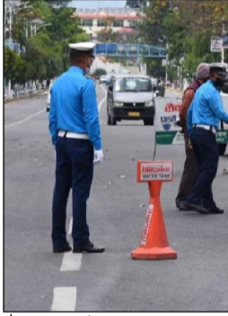
साझाकुरा संवाददाता हेटौंडा, २५ साउन/ बागमती प्रदेशमा सवारी साधन कारबाहीबाट २६ करोड रुपैयाँ भन्दा बढी जरिवाना रकम संकलन गरिएको छ । बागमती प्रदेश प्रहरी कार्यालय हेटौंडा अन्तर्गत काठमाडौँ उपत्यका बाहेकका १० जिल्लामा बित्तिको आर्थिक वर्षमा सवारी साधनलाई कारबाही गरेबापत २६ करोड ५०० सय रुपैयाँ जरिवाना रकम संकलन गरेको हो । बित्तिको आर्थिक वर्ष २०७९/८० मा २ लाख ९१ हजार २९३ वटा सवारीका साधनलाई कारबाही गरिएको हो । ट्राफिक नियम उल्लंघन गरी सवारी चलाएबापत यो रकम संकलन गरिएको प्रदेश प्रहरी कार्यालय हेटौंडाले जनाएको छ ।