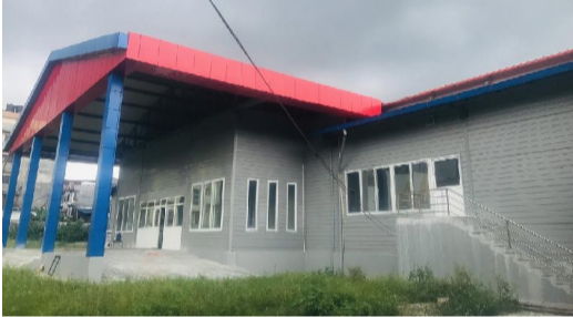
अठ्ठै एक वर्ष लाग्ने

विशा मूख हेटौंडा, ४ असोज/१८ महिना निर्माण सम्पन्न गर्ने ठाउँको साध सम्भोता भएको बावजुद प्रदेश सरकारको नयाँ भवन ४ वर्षसम्म पनि निर्माणमात्रै अवस्थामा छ। डेढका विभिन्न शैतिक पुर्वाधार विकास मन्त्रालय र डेढव्यार कम्पनीबीच समझौता सही सम्झौता नहुँदा प्रशासनको अर्थ भवन अर्कै निर्माण सम्पन्न हुन नसकेको हो। भवन निर्माणको लागि ठेकेदारको म्यादमन्त २७ महिना बढी समय सकिँदासम्म बागमती प्रदेशमा सचिवालय भवन निर्माण सकिएको छैन। प्रदेश सरकार सञ्चालनको लागि सभाकक्ष साँघुरो भएपछि अधिस्तरीय कार्यकालमा ससद सचिवालय निर्माणको काम थालिएको थियो तर, हालसम्म अधुरै छ।