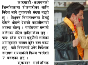
ट्रेलरमा उज्वल अभिनेत्री सपनासहित विदेशीन बाइल युवा र सन्तानको सम्पर्क र पछाडमा दिन काटिरहेका आमाबुबाको कथा देखाइएको छ ।

ट्रेलरको प्रभाव: दूरस्थ भूमिस्थित युवा र सन्तानको सम्पर्क र पछाडमा दिन काटिरहेका आमाबुबाको कथा देखाइएको छ । ट्रेलरको प्रभाव: दूरस्थ भूमिस्थित युवा र सन्तानको सम्पर्क र पछाडमा दिन काटिरहेका आमाबुबाको कथा देखाइएको छ । ट्रेलरको प्रभाव: दूरस्थ भूमिस्थित युवा र सन्तानको सम्पर्क र पछाडमा दिन काटिरहेका आमाबुबाको कथा देखाइएको छ ।