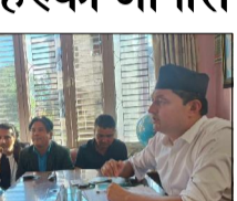
विहीबार दिउँसो निर्माता संघमा फिल्म सम्बद्ध संघ-संस्थाहरूबीच छलफल समेत भएको थियो ।

आपत्ति जनाउँदै फेसबुकमा लेखेका छन्, 'चलचित्र विकास बोर्ड'लाई सञ्चार मन्त्रालयको एउटा शाखाको रूपमा परिचय गराएको विधेयक अस्वीकार्य छ । यो विधेयक नेपालको संविधान र संवैधानिक परिपक्वता छ । फिल्मकर्मीहरूको सदस्यता, सञ्चालना, भावना र रेषागत सुरक्षाको प्राप्ति बिना विधेयक परिष्कार गरिएकोमा अत्यन्तै निराशा जनाए ।