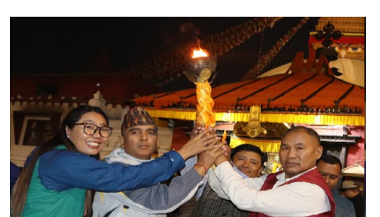
जलवायु परिवर्तन र यसले हिमालय क्षेत्रमा पारेको असरबारे अन्तर्राष्ट्रिय समुदायको ध्यानाकर्षण गराउन लुम्बिनीबाट सुरु भएको 'पिस टर्च' काठमाडौँ ल्याइएको छ ।