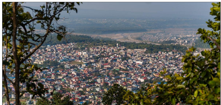
मोडलबाट सोचेर जान उनले होटल व्यवसायीलाई आग्रह गरेका छन् ।

हेटौंडा, २२ पुस/ भारतीय सीमाबाट नजिक भएकाले विहारका पर्यटक हेटौंडा ल्याउने योजना बन्नुपर्छ । तराईका सर्लाहीदेखि रौतहट, बारा, पर्सा र चितवनकै नजिक भएकाले पनि आन्तरिक पर्यटकलाई आकर्षित गर्न हेटौंडाले सक्नुपर्छ । तर, भइदियो उल्टो । तराईवासीका लागि हेटौंडा राजमार्ग हुँदै अन्यत्र जाने 'बाइपास सहर' जस्तै बनेको छ । चितवनबासीका लागि हेटौंडा पर्यटकीय गन्तव्य कहिल्यै बन्न सकेको विगतले देखाउँदैन । भारतीय पर्यटक हतपत बारा र मकवानपुरको सीमाक्षेत्र चुरेको डाँडो कट्टै नन् । भारतीय पर्यटकको आकर्षणलाई हेटौंडाले नसकेको छ ।