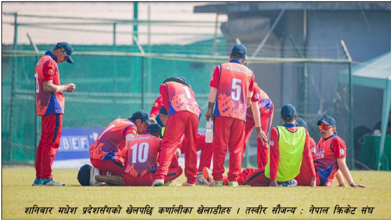
शनिवार मधेश प्रदेशसँगको खेलपछि कर्णालीका खेलाडीहरू ।

काठमाडौं / कर्णाली प्रदेशले क्रिकेटको राष्ट्रिय प्रतियोगिता खेल्न थालेको पाँच वर्ष भन्दा बढी भइसक्यो । उसले सन् २०१८ मा प्रधानमन्त्री कप एकदिवसीय राष्ट्रिय प्रतियोगिताको दोस्रो संस्करणदेखि सहभागिता जनाइरहेको छ । सुरुवाती दुई संस्करण कर्णाली जितेको थियो । सन् २०२१ जनवरी १९ मा कर्णालीले मूलपानी मैदानमा गण्डकी प्रदेशलाई ५ विकेटले हराउँदै प्रधानमन्त्री कपमा पहिलो जित दर्ता गरेको थियो । कर्णाली प्रदेशमा एउटा पनि क्रिकेट मैदान छैन । आफ्नै मैदान नहुँदा पनि उसको प्रदर्शन भने भन् भन् सुधार हुँदै गएको छ ।