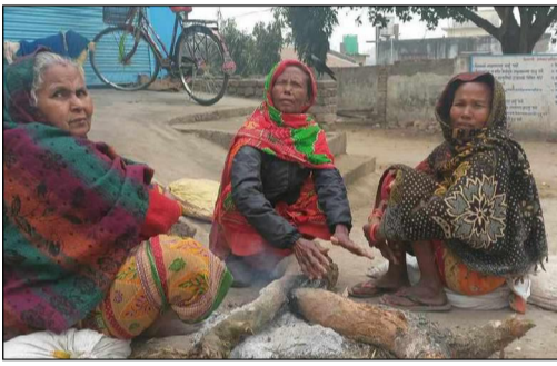
प्रारम्भिक चिसोले बारका स्थानीय गरिब र विपन्न परिवारहरू बढी प्रभावित भएका छन् ।

बारा/लगातार २ सातादेखि बढेको चिसो र शितलहरले बारका स्थानीय गरिब र विपन्न परिवारहरू बढी प्रभावित भएका छन् । विहानदेखि नै लागेको वाक्लो हुस्सु शितलहरसँगै दिनभर लागेको कृषीका कारण घाम नलागेपछि जनजीवन प्रभावित बन्न थालेको हो ।