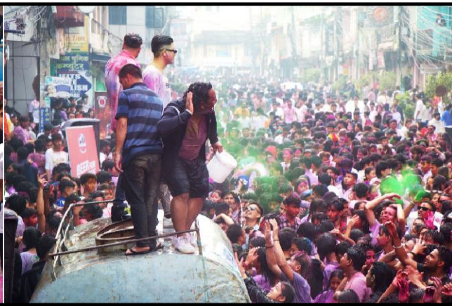
नेपाली समाजलाई विशिष्ट पहिचान दिलाउने पर्वमध्ये फागुपूर्णिमा एक महत्वपूर्ण पर्व हो । आइतबार पहाडी तथा हिमाली एवम् सोमबार भित्रीमधेश र तराईका जिल्लामा मनाइएको होलीपर्वलाई विजयोलसवको रूपमा पनि लिइन्छ । हेटौंडाको स्कूलरोडमा आइतबार स्थानीय युवा होली पर्व मनाउँदै ।