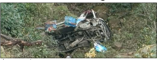
साझाकुरा संवाददाता हेटौंडा, १२ चैत / मकवानपुरको बकैया गाउँपालिका-११ बाघघारामा आइतबार बस भिर्बाट खसेर दुर्घटना भएको छ । कान्तिनोकपथ सडक अन्तर्गत हेटौंडाबाट काठमाडौंतर्फ जाँदै गरेको बा ३ ख ५६५७ नम्बरको खाली बस दुर्घटना भएको जिल्ला प्रहरी कार्यालय मकवानपुरले जनाएको छ ।

प्रहरीका अनुसार आइतबार बिहान साढे ८ बजेको समयमा भएको बस दुर्घटनामा मानवीय क्षति भएको छैन । खाली बस ओरालोमा आउने क्रममा आफै अतिरिक्त भई सडकबाट करिब ३०० मिटर तल सिमातखोलाका खसेर दुर्घटना भएको प्रहरीले जनाएको छ ।