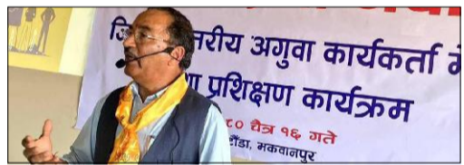
प्रणाली भ्रष्टतन्त्रमा रणान्तरण भएको चर्चा गर्दै थापाले राजसहितको प्रजातन्त्र र हिन्दुराष्ट्रको मार्गचित्रले मात्र मुलुक स्थिर र प्रगतिताफर्त जाने धारणा व्यक्त गरे । संघीयताको नाममा अनावश्यक भारी देशले धेरै नसक्ने भन्दै संघीयता खारेज गर्नुपर्ने आवाज पनि अध्यक्ष थापाले जोडदार रूपमा उठाए । कार्यनीतिका कारण राष्ट्रपासंगको एकता शिक्षण भन्दै गएको भन्दै उनले राष्ट्रपा सत्ताकेन्द्रित मानसिक्ताबाट ग्रस्त भएको टिप्पणी गरे ।

हेटौंडा, १६ चैत / राष्ट्रिय प्रजातन्त्र पार्टी नेपालका अध्यक्ष कमल थापाले धर्म परिवर्तन डरलाग्दो समस्याको रूपमा देखिएको बताएका छन् । नास्तिकता बढाउन विदेशी पैसा प्रयोग भएको बारे सरकारले छानबीन गरी कारबाही गर्नुपर्ने अध्यक्ष थापाले बताएका छन् ।