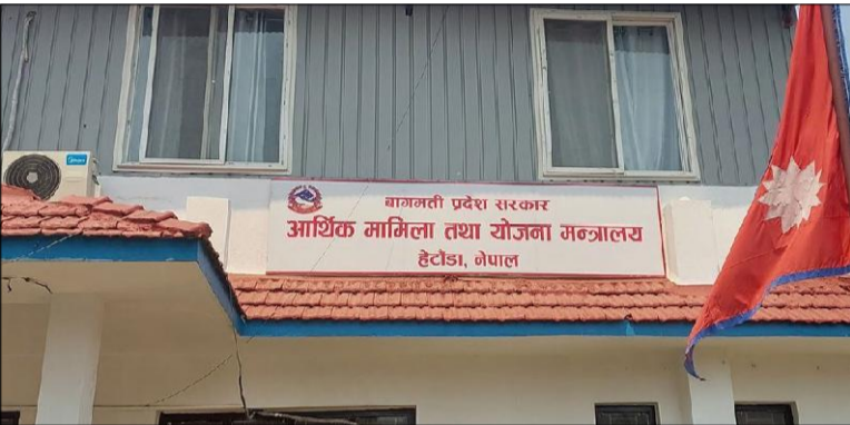
मामिला तथा योजना मन्त्रालयले १२ र २० चैतमा दुईपटक सम्बन्धित मन्त्रालयमा थपिएका योजना प्रदेश सरकारको बजेट सूचनाप्रणाली (पीएलएमबीआईएस)मा प्रविष्ट गर्न पत्राचार गरेको थियो ।

२९ फागुनको प्रदेशसभा बैठकले समितिको प्रतिवेदन पास गर्दै सरकारलाई सुझाव कार्यान्वयन गर्न निर्देशन दिएको थियो । जसअनुसार ६७ करोड बराबरका ४३७ वटा टुक्रे योजना थप गर्न आर्थिक मामिला मन्त्रालयले पत्राचार गरेको हो । थपिएका योजना प्रदेशको आर्थिक