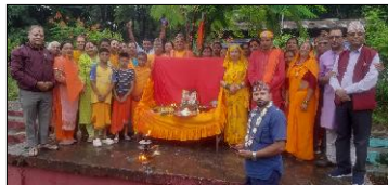
साझाकुरा संवाददाता हेटौंडा, २८ साउन/ सप्तकोशी नदीको किनारमा गोरक्षश्वर धाममा गङ्गाआरती सुरु भएको छ । आगामी दिनांक २९ साउनमा गङ्गाआरती सुरु गरिने भएको छ ।

सप्तकोशी नदीको किनारमा गोरक्षश्वर धाममा गङ्गाआरती सुरु भएको छ । आगामी दिनांक २९ साउनमा गङ्गाआरती सुरु गरिने भएको छ । सप्तकोशी नदीको किनारमा गोरक्षश्वर धाममा गङ्गाआरती सुरु भएको छ । आगामी दिनांक २९ साउनमा गङ्गाआरती सुरु गरिने भएको छ ।