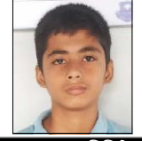
आकृष्ट शिशु सदन

बुबा तिमी मेरो जीवनको सूर्य तिमीलाई उज्याै पार्छु तिमीले खनेके बाटोमा हिँड्छु तिमीले पूरा नगरेको सपना अब गर्छु म पूरा