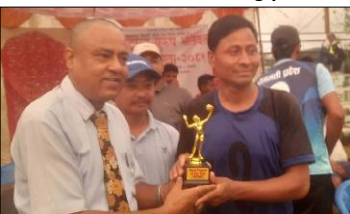
शुक्रबारको अन्तिम सेमिफाइनल खेलमा हेटौंडा-१९ नारायणी क्लबसँग पराजित भए ।

हेटौंडा, ४ असोज / हेटौंडाको हनुवैरमा जारी क्लिमास्त्रिय भेट्रान्स भलिबल प्रतियोगिताको सेमिफाइनल संस्करण पूरा भएको छ । शुक्रबारको खेलमा सेमिफाइनल पुगे चारै टोलीको टुंगो लागेको हो । प्रतियोगिताको फाइनल प्रवेशको लागि मकवानपुरगढी गाउँपालिकाले नारायणी क्लबसँग र भीमफेदी गाउँपालिकाले हेटौंडा-१९ सँग प्रतिस्पर्धा गर्नेछ ।