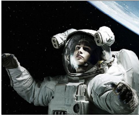
कसले जान सक्छ

दुईजना व्यक्ति । एक अर्बपति र अर्को इन्जिनियर । दुवैले गत सेप्टेम्बर १२ मा एलन मस्कको कम्पनी स्पेस एक्सको पोलारिस्ट डन अन्तरिक्ष मिशनमार्फत अन्तरिक्षमा हिंडेर (स्पेसवाक) गरेर कीर्तिमान कायम गरे ।