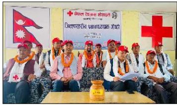
जिल्लाका संस्थापक तथा सामुदायिक गरी १०० विद्यालयका प्रधानाध्यापक सहभागी गोष्ठीले शैक्षिक संस्थामा रेडक्रसलाई अभियानको रूपमा संचालन गरी जुनियर/युवा संकेल गठन तथा पुनर्गठन गर्ने जिल्लास्तरीय जुनियर/युवा कोष निर्माणका लागि एक जुनियर/युवा १० वर्षीय सहयोग अभियान संचालन गर्ने, पालिकास्तरीय प्राथमिक उपाचार तथा विपद व्यवस्थापन लगायत विभिन्न तालिम संचालन गर्ने निर्णय गरेको छ।

हेटौंडा, ४ असोज / नेपाल रेडक्रस सोसाइटी मकवानपुर शाखाको आयोजनामा जिल्लास्तरीय आधारभूत तथा माध्यमिक प्रथमवर्षा पढाउने गोष्ठी भएको छ।