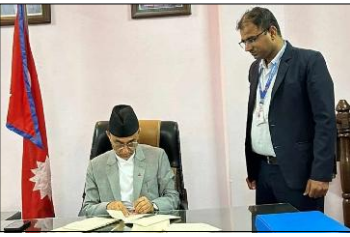
यस विधेयक प्रमाणीकरणका लागि प्रदेशसभाको अधिवेलो बैठकले सर्वसम्मतरूपमा पास गर्दै प्रदेश प्रमुख समक्ष पठाएको थियो। 'प्रदेश प्रमुखले कृषि तथा पशुपन्छी विकास मन्त्री र उद्योग, वाणिज्य, भूमि तथा प्रशासन मन्त्रिसँग आलोचना छलफल गरेर विधेयक प्रदेशसभामा फिर्ता पठाउनु भएको हो', प्रदेश प्रमुख कार्यालय स्रोतले भन्यो।