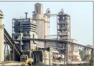
हेटौडा, २ कात्तिक/ सरकारी स्वामित्वको हेटौडा सिमेन्ट उद्योग लिमिटेडमा लाखौं मुल्यको तार चोरी भएको घटना साम्वन्धक भएको छ। घटना भएको हप्ता दिन बिनेपछि घटना बाहिर आएको हो।

हेटौडा, २ कात्तिक/ सरकारी स्वामित्वको हेटौडा सिमेन्ट उद्योग लिमिटेडमा लाखौं मुल्यको तार चोरी भएको घटना साम्वन्धक भएको छ। घटना भएको हप्ता दिन बिनेपछि घटना बाहिर आएको हो। चोरी भएको हप्ता दिन बिना पनि घटना गुपचुपै राख्नु रहस्यमय बनेको छ। हेटौडा-९, लामसुरमा रहेको उद्योगमा असोज २२ गते राति १० लाख भन्दा बढी मुल्यको कसरीमा प्रयोग हुने तार चोरी भए पनि यस विषयमा प्रहरी-प्रशासन बेखबर रहेको छ।