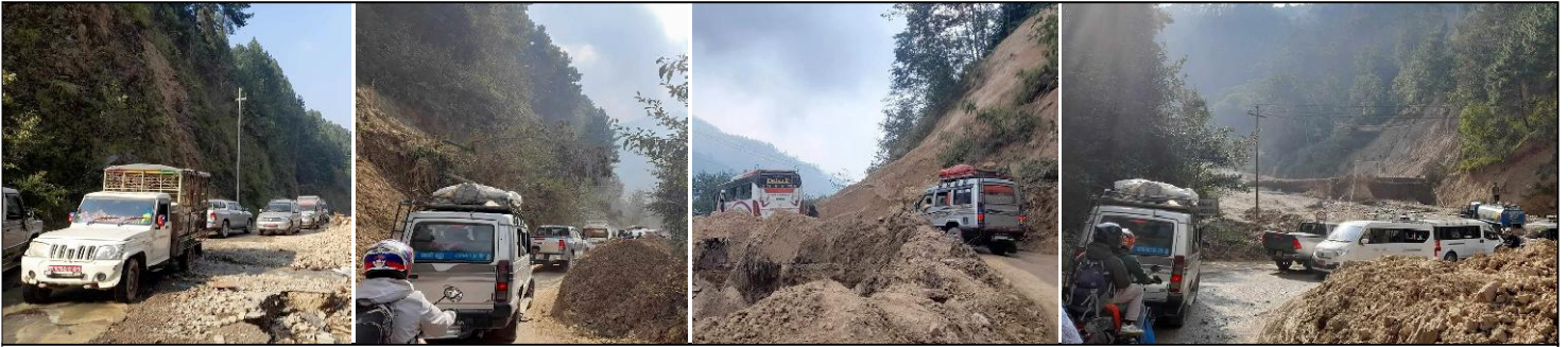
हेटौडा-काठमाडौंको कटपुर्ण यात्रा: हेटौडा-काठमाडौं जोड्ने छोटो मार्गका दुई वटा सडक बन्द भएपछि कानिनेलोकपथमा लागेको सवारीसाधनको लामो जाम। कच्ची सडक र चपटोसम्मको जामले यात्रुहरूलाई धेरै दुई सहर आवतजावत कटपुर्ण बनेको छ। मकवानपुरको कुन्धेखानी-फाखेल र सिलेरी-दशैणकाली सडक बन्द गरिएपछि सवारीसाधनहरू कानिनेलोकपथ भएर आवतजावत गरिरहेका छन्। निर्यात बाटो बन्द हुँदा वैकल्पिक मार्ग कानिनेलोकपथ-हेटौडा-दिगन्-काठमाडौं बट्ट प्रयोग हुँदा सवारीको अत्यधिक जाम भएको हो। इन्द्रसरोवर गाउँपालिका-२ सिमखोला बजारको डाइभर्सनमा ह्युम पाइप राख्नुपर्नेले शुक्रबारदेखि तीन दिनसम्म दुई सडक बन्द गरिएको जिल्ला प्रशासन कार्यालय मकवानपुरले जानकारी दिएको छ। वैकल्पिक बाटोसमेत पहिरोले एकापिमाथै सञ्चालन भएकोले सवारी चालक र यात्रुले सास्ती व्यहोर्ने यात्रा गरिरहेका छन्।