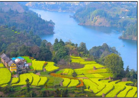
मकवानपुरको पर्यटकीय गन्तव्य कुलेखानी अर्थात् इन्द्रसरोवर तानसँगै जोडिएको गाउँका बारीमा फुलेको तोरी। बोटिङ स्पेशल, पदमार्गसँगै भन्नेरज्ज्वरका लागि जन सन्धि कुलेखानीलाई यतिबेला फुलेको तोरीबारीले झनै मनमोहक बनाएको छ। यहाँ किसानले व्यावसायिकरूपमा छुटेको तोरी फुल्न थालेको छ। कुलेखानी तालको आसपासका बारी यतिबेला तोरीको फुलने पहिलेको हो।